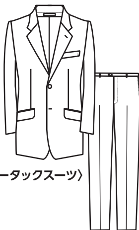
〈ノータックスーツ〉