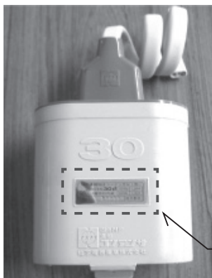
写真2 低圧進相コンデンサ。 [ ]内のプレートが銘板

なお、今特集の末尾に社団法人日本電機工業会および低圧進相コンデンサの製造業者一覧を掲載したので、詳細についてはこちらにお問い合わせいただきたい。