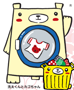
洗太くんとカゴちゃん