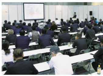
※セミナーの過去開催風景